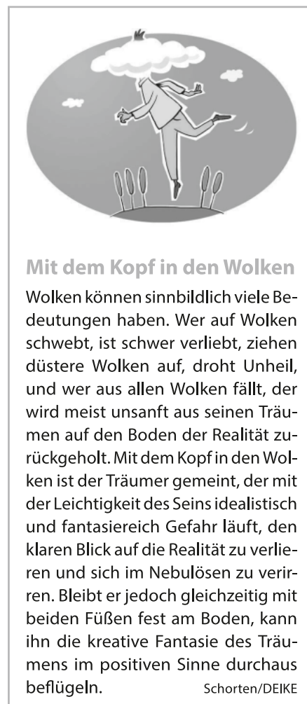
Illustration: © droigks/DEIKE