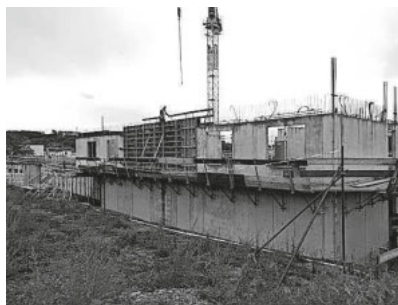
Baustelle am Sonnenstück 25.09.2020