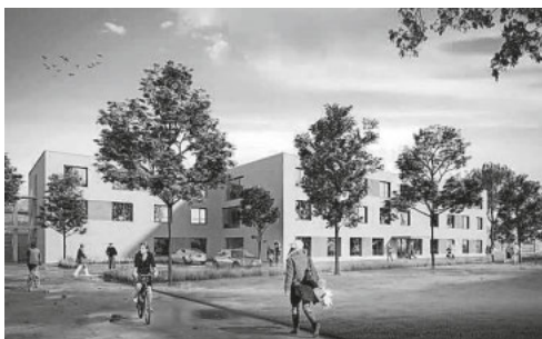
Entwurf Pflegeheim Schliengen