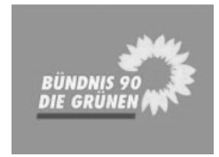
Ortsverband Schliengen-Bad Bellingen

Der Ortsverband Bündnis 90 Die Grünen Schliengen-Bad Bellingen lädt dazu ein, mit der Bundestagskandidatin von Bündnis 90 Die Grünen für den Wahlkreis Lörrach-Müllheim ins Gespräch zu kommen. Im Bürger- und Gästehaus Schliengen wird sie am 11. Februar 2025 ab 19:00 Uhr in einer Küchentisch-Atmosphäre auf die Fragen und Anregungen der Gäste eingehen und ihre Schwerpunkte klimaneutrale Wirtschaft und Fachkräfte erläutern.