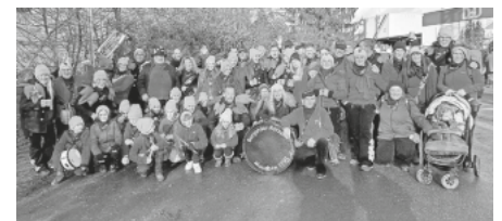
Bild: Die Burgunder Rätzer mit ihren Rätzer-Triebele hatten eine schöne Fasnacht

Ein besonderer Dank erging an Rüdiger und Sabine Ulbrich für ein Jahrzehnt Bühnenmoderation.